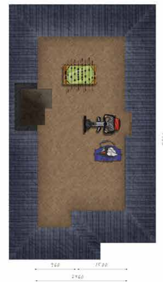
Voorbeeld tweede verdieping