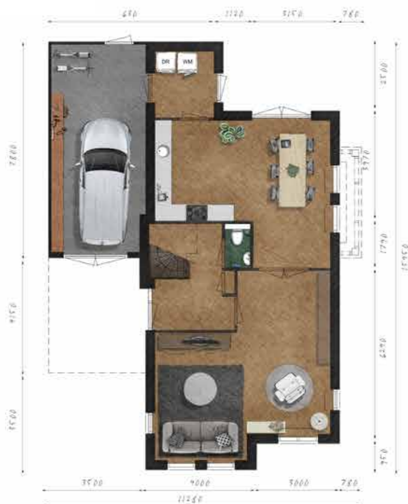
Voorbeeld begane grond