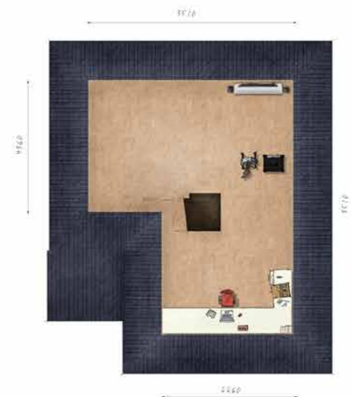
Voorbeeld tweede verdieping