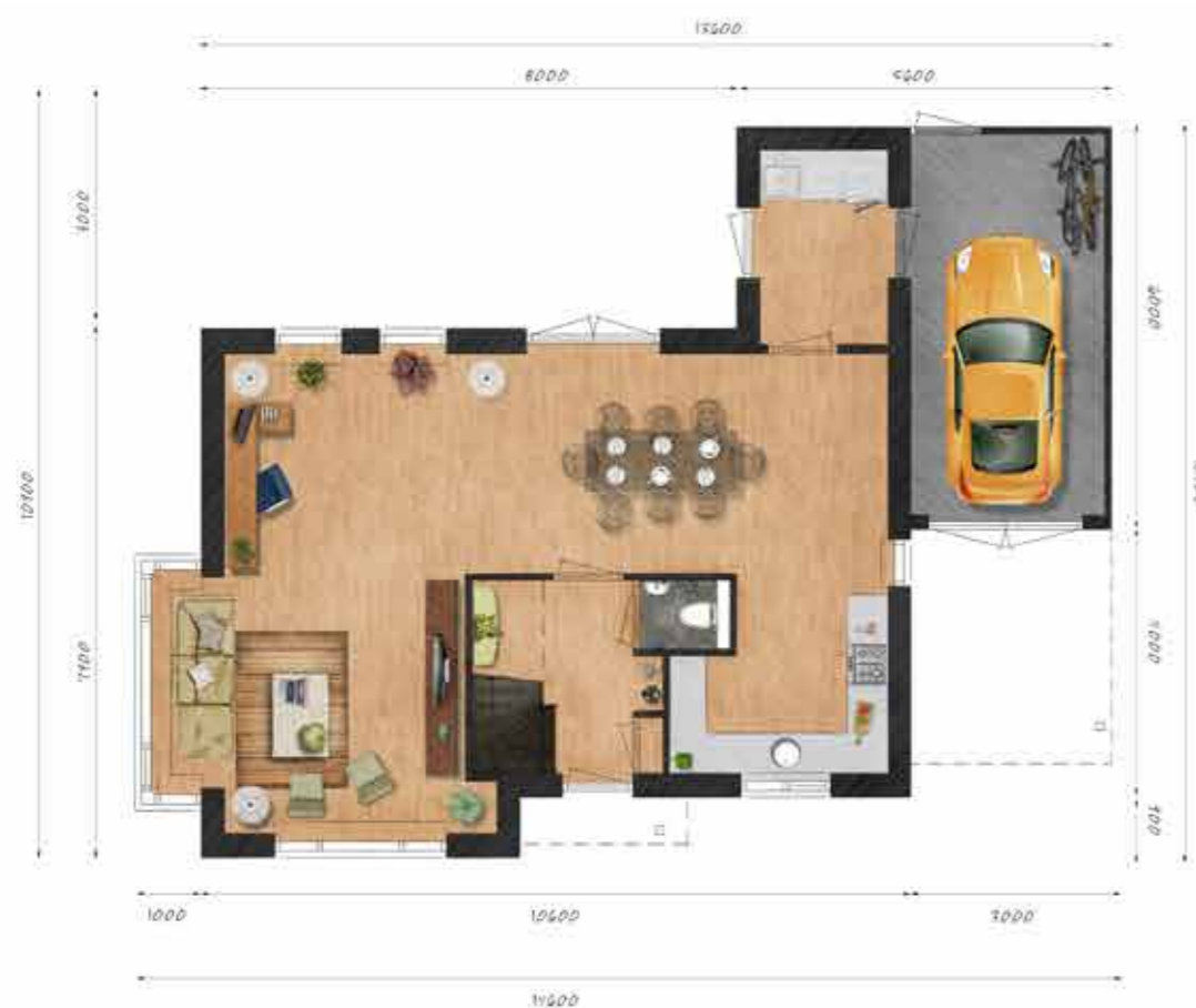
Voorbeeld begane grond