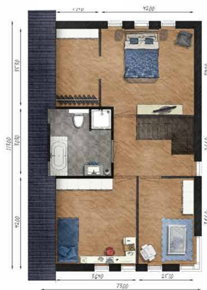
Voorbeeld eerste verdieping