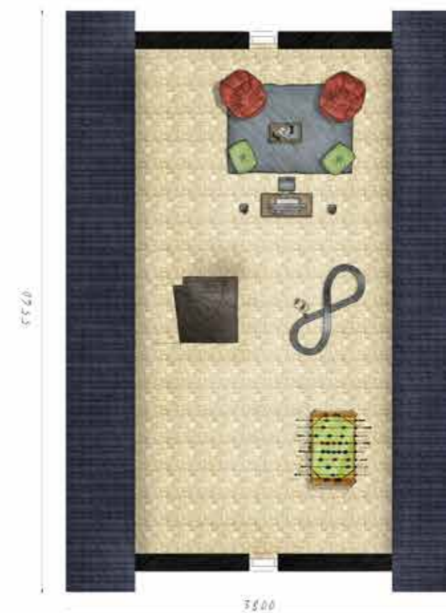
Voorbeeld tweede verdieping