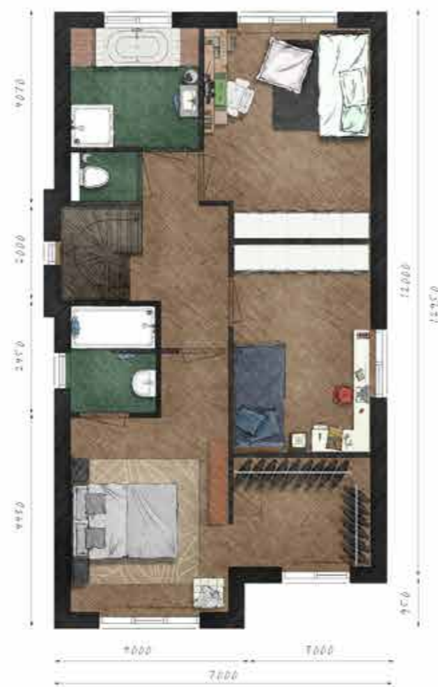
Voorbeeld eerste verdieping