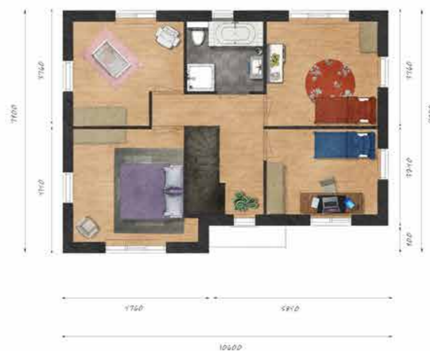
Voorbeeld eerste verdieping