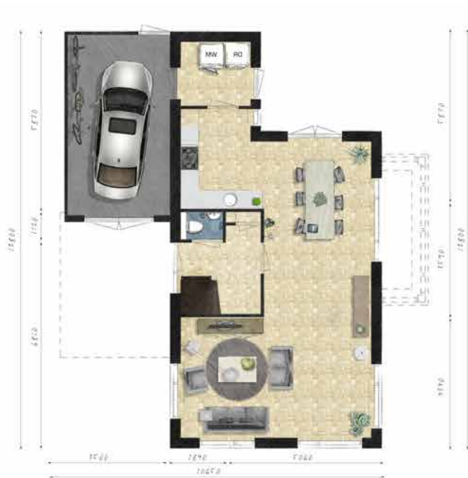
Voorbeeld begane grond