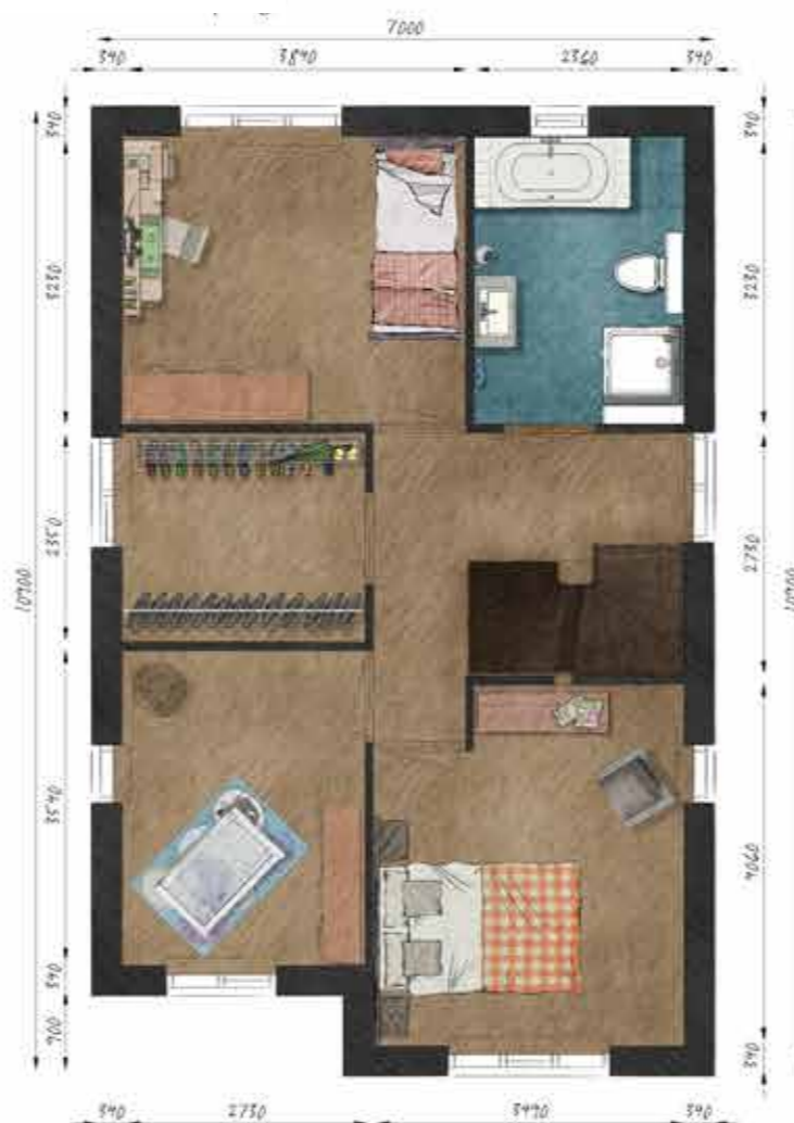
Voorbeeld eerste verdieping