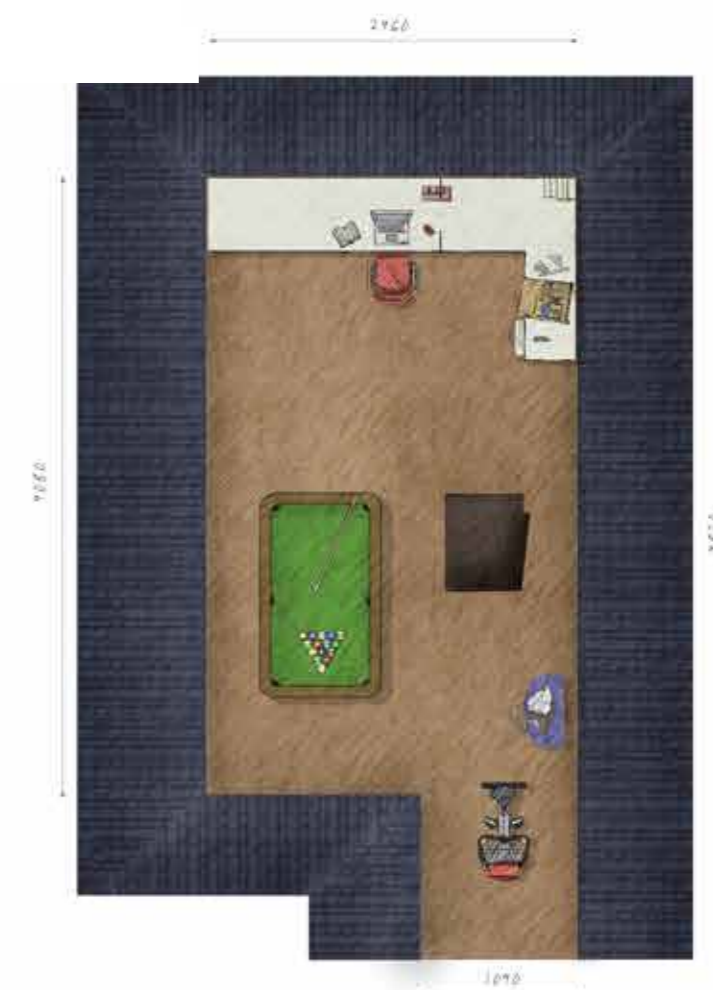
Voorbeeld tweede verdieping