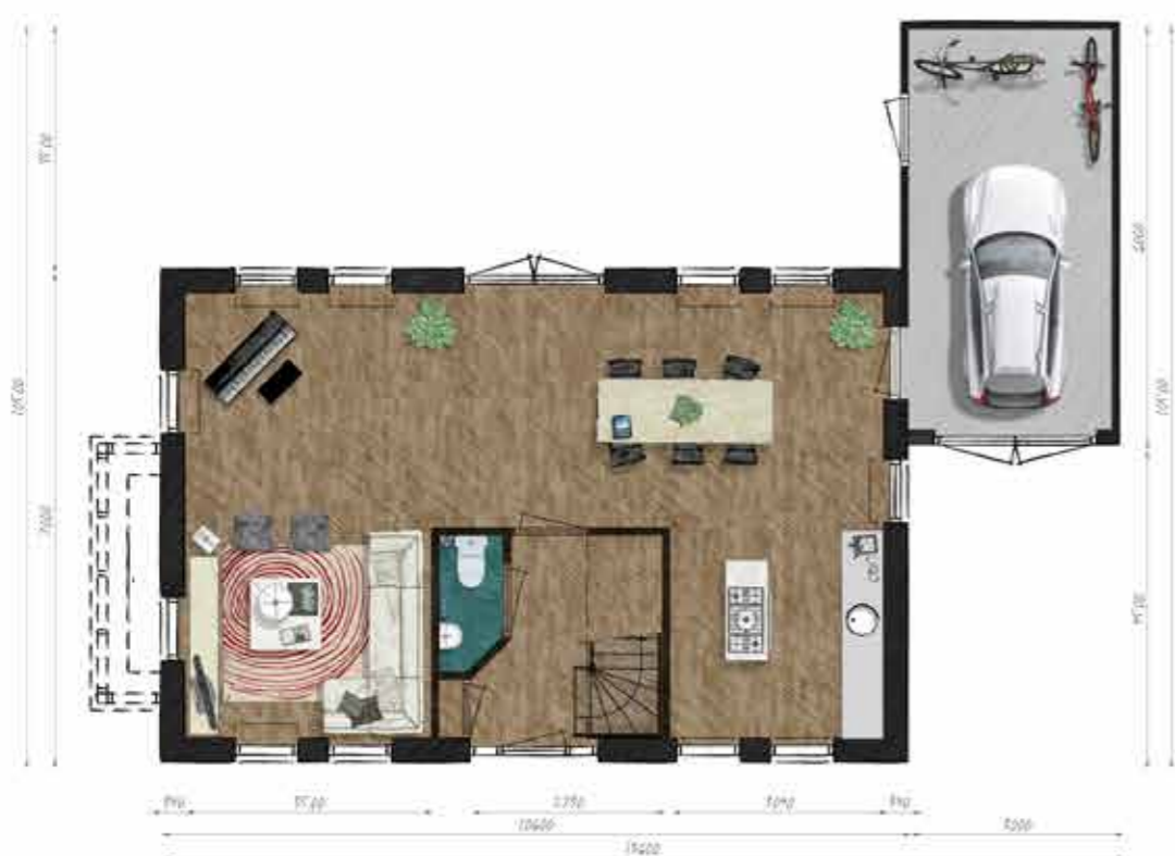
Voorbeeld begane grond