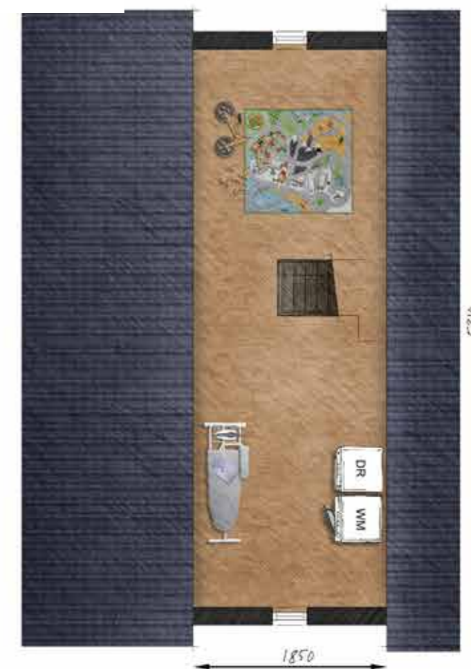
Voorbeeld tweede verdieping