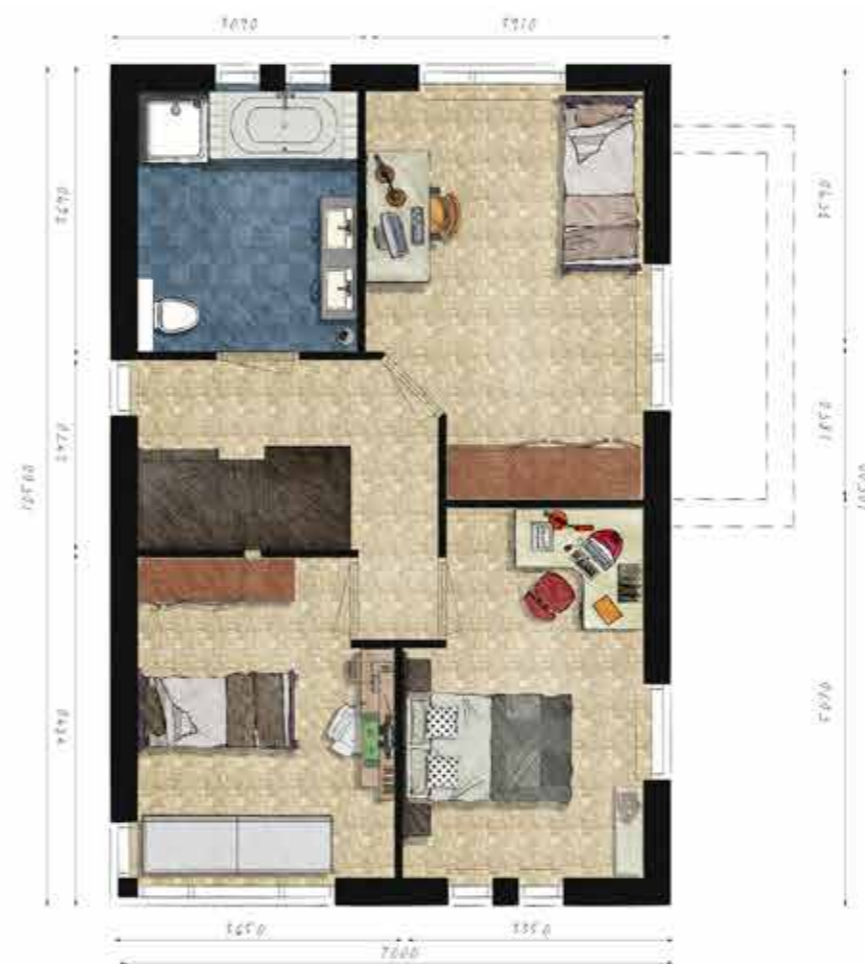
Voorbeeld eerste verdieping