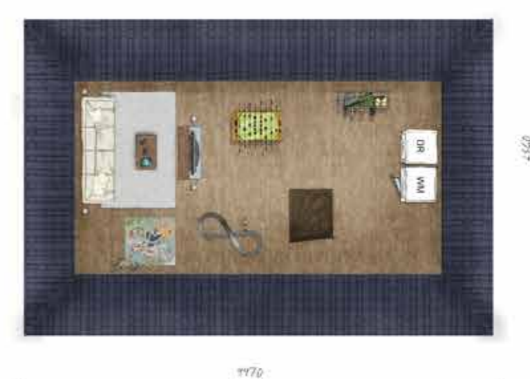
Voorbeeld tweede verdieping