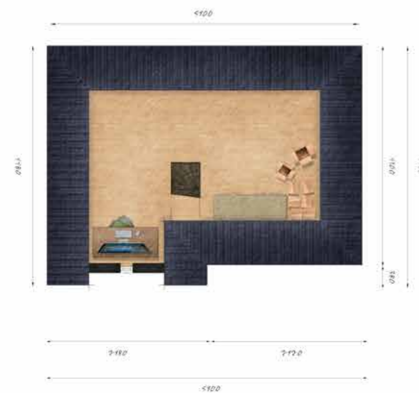
Voorbeeld tweede verdieping