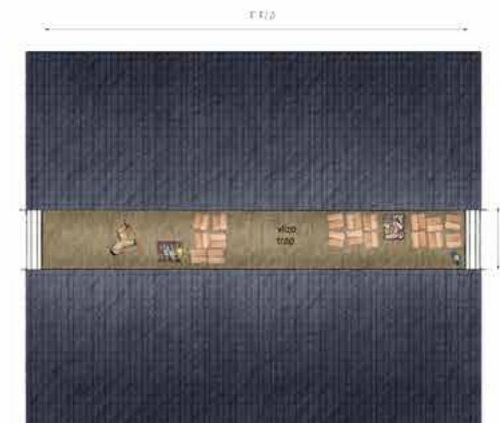
Voorbeeld tweede verdieping