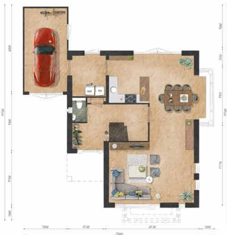
Voorbeeld begane grond