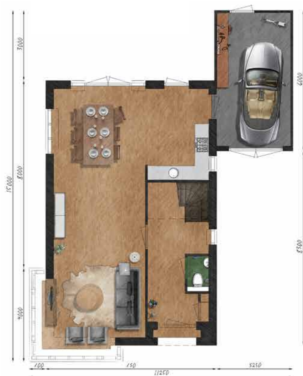
Voorbeeld begane grond