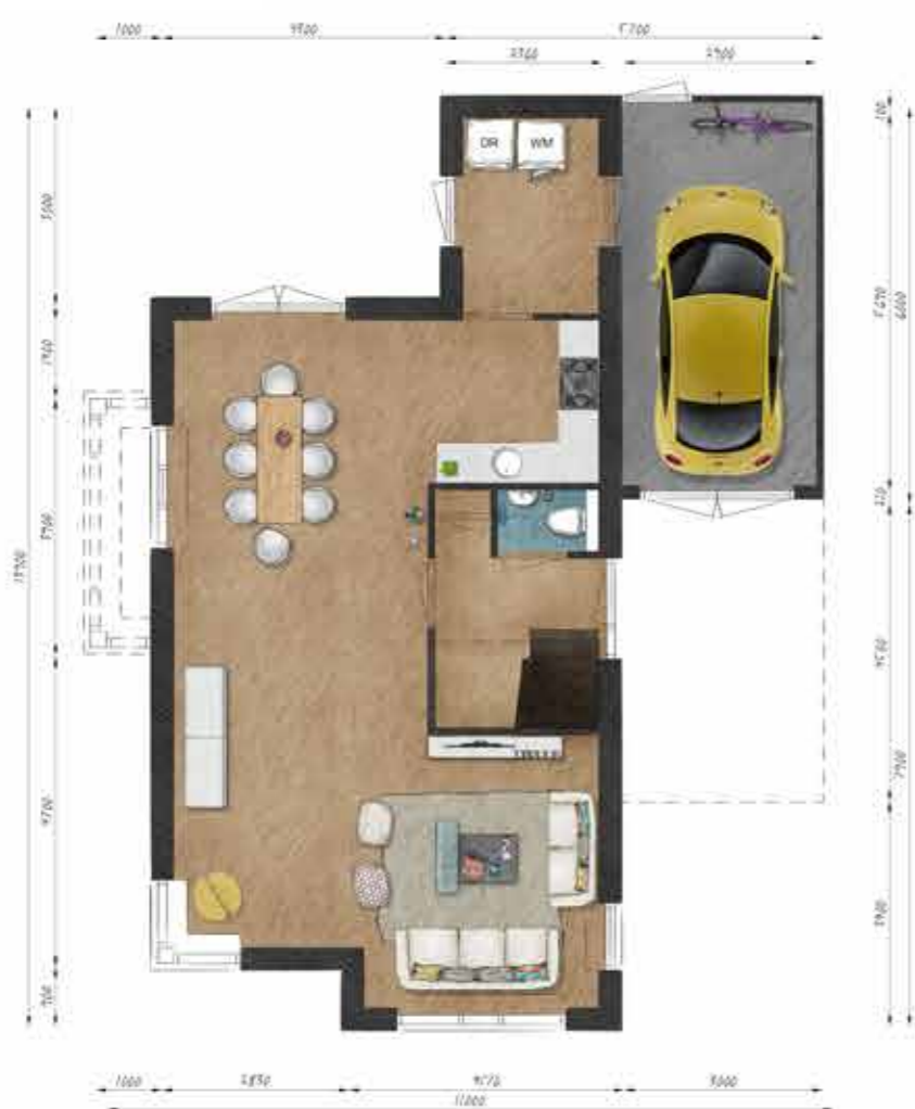
Voorbeeld begane grond