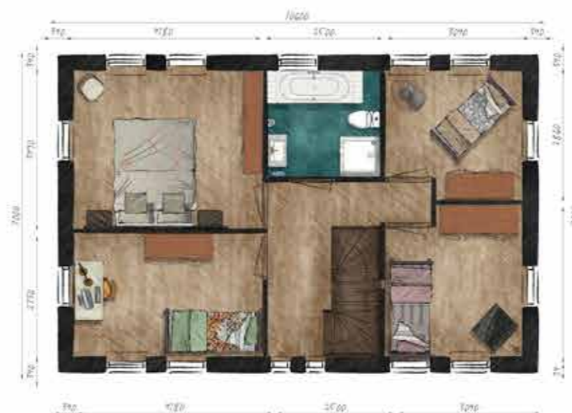
Voorbeeld eerste verdieping