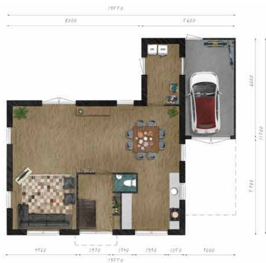
Voorbeeld begane grond