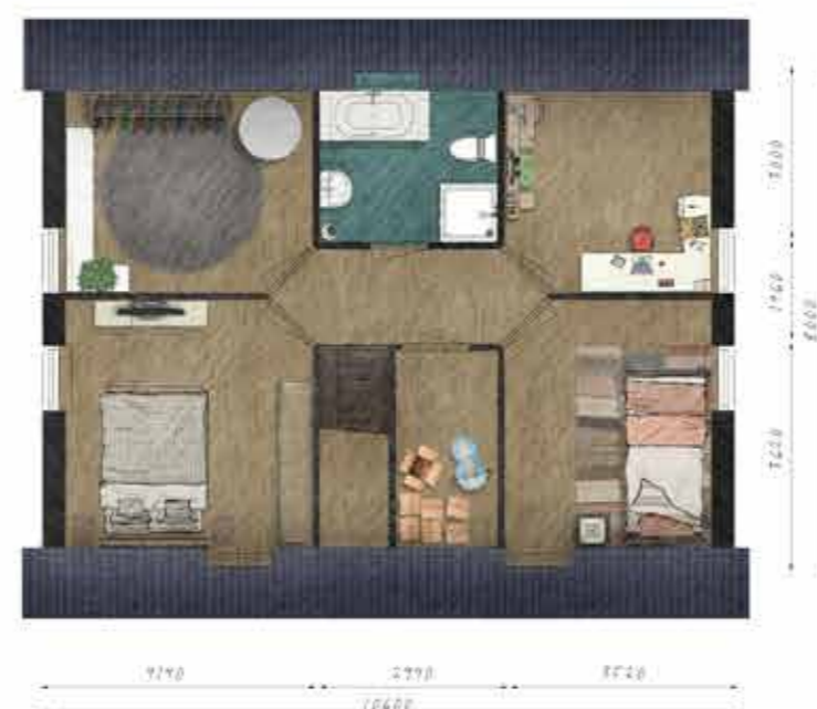
Voorbeeld eerste verdieping