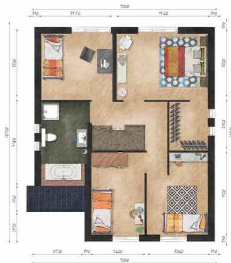
Voorbeeld eerste verdieping